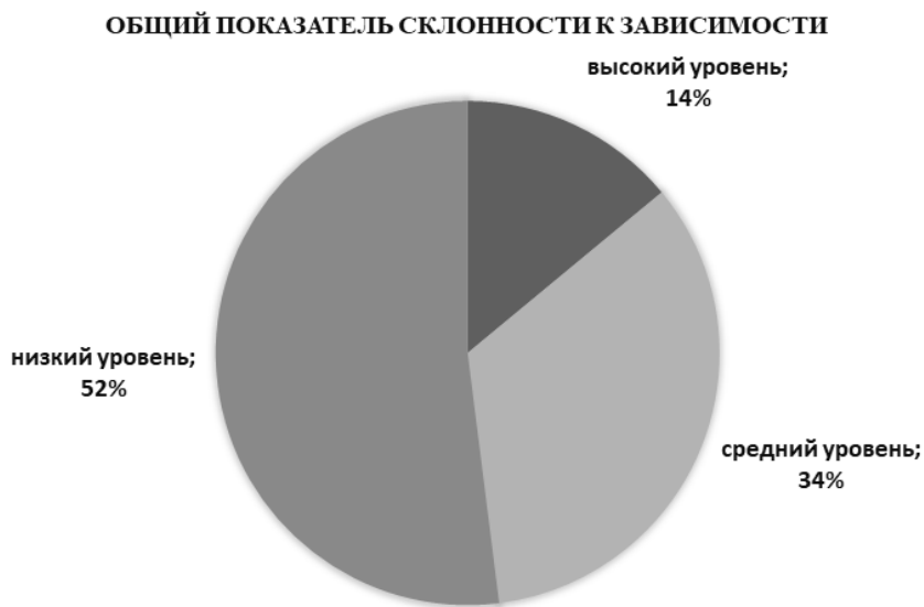
Рисунок 3 – Показатели общей степени склонностей к зависимому поведению подростков (в % соотношении по группе обследуемых)

В результате обследования испытуемых по итоговому баллу, характеризующему общую степень склонностей к зависимому поведению, можно констатировать, что высокий уровень обнаружен у 14% обследуемых подростков, средний уровень – у 34% подростков, низкий уровень у большей части выборки (рисунок 3).