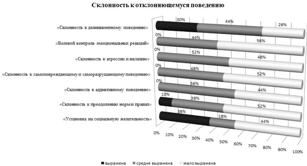
Рисунок 2 – Показатели склонности подростков к отклоняющемуся поведению (в % соотношении по группе обследуемых)