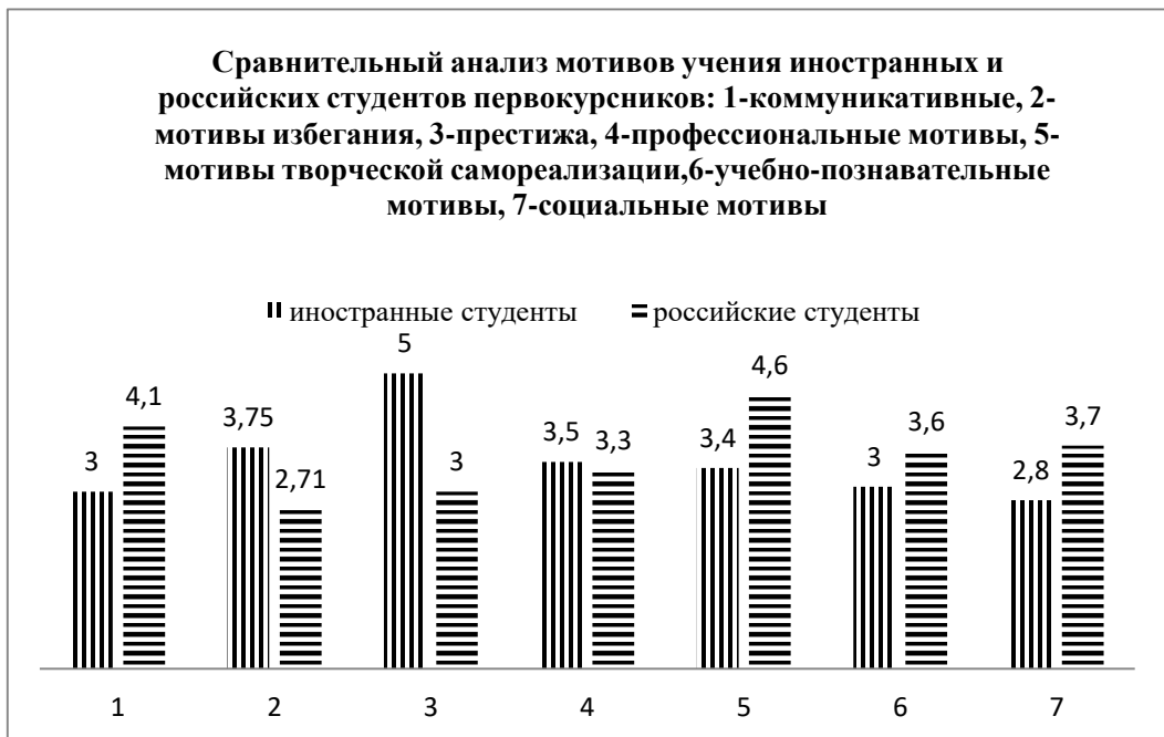
Рисунок 2 – Средние баллы выраженности мотивов

Анализ рисунка показал, что у иностранных студентов в мотивации учения значимо выражены мотив престижа U_{эмп} = 151,5 (p \leq 0,01) и избегания U_{эмп} = 156 (p \leq 0,01) . Это означает, что туркмены первокурсники учатся, чтобы быть на хорошем счету у преподавателей, добиться одобрения родителей, попав в университет, вынуждены учиться, чтобы окончить его, так как «жизненно» необходим диплом о высшем образовании.