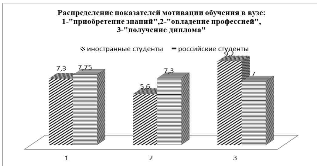
Рисунок 1 – Распределение показателей мотивации обучения в вузе у иностранных и российских студентов первокурсников, в среднеарифметических баллах

Сравнительный анализ результатов по методике «Мотивация обучения в вузе» Т.И. Ильиной показал, что для студентов обеих исследуемых групп важно получение диплома о высшем образовании, но у иностранных студентов данный показатель мотивации учения достоверно выше U_{эмп} = 67,5 ( p \leq 0,01 ). Результаты сравнительного анализа представлены на рисунке 1.