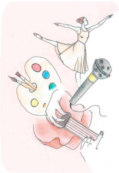
Рисунок 1 – Пример № 1. Изображение из колоды «КВаРЦ»

Метафорические ассоциативные карты «Карта ваших реальных ценностей» (Т.В. Капустина, В.В. Коренчук, Р.В. Кадыров, автор рисунков – О.И. Федотова), сокращённо «КВаРЦ», следует относить к числу специализированных, позволяющих определить ценностные ориентации, цели, главные желания, ценностные конфликты, наличие социальных страхов (т.е. страхов, связанных с обществом и социальным статусом) у человека [1]. Колода представляет собой 36 изображений, на которых представлены люди обоих полов и разных возрастов, выполняющие какие-то дела или находящиеся в каких-то конкретных социальных ситуациях (Рис. 1, 2), 90 слов, представленных существительными, прилагательными, наречиями, включающими базовые эмоции (например, «любовь», «радость», «грусть» и т.д.), слова, относящиеся к ценностям в общем, а также к карьере, учёбе, семье, обществу, досугу, физической активности (например, «важно», «профессиональный путь», «познание», «моя семья», «другие люди», «самовыражение», «спорт»), а также – оценочные суждения и качества людей (например, «незначимый», «значимый», «исполнительность», «воспитанность») и 20 символов (пунктуационных, математических) (рисунок 3). Подобное сочетание вербальных стимулов с невербальными, представленными в виде изображений и символов, поможет увеличивать вариативность подходов к конкретному человеку в консультативной деятельности, давать тройное воздействие и строить прочный мост между сознательным и бессознательным клиента.