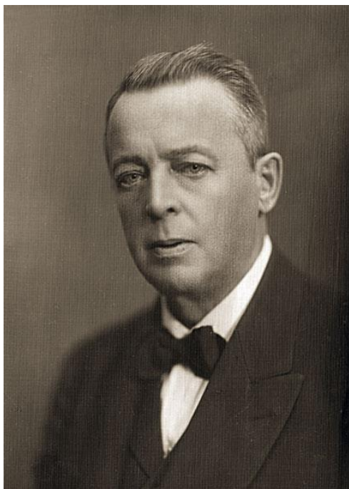
Рисунок 3 – Ф.О. Шехтель, 50-53 года

В 1906 года Шехтель стал председателем Московского археологического общества и продолжал руководить им до 1922 года. Общество московских архитекторов и строителей объединяло более 150 человек и играло заметную роль в общественной жизни Москвы. Благодаря инициативе Шехтеля в 1910 г. при Московском археологическом обществе появилась комиссия по изучению Старой Москвы. Он планировал, что со временем должен появиться Музей Старой Москвы [4, с. 19].