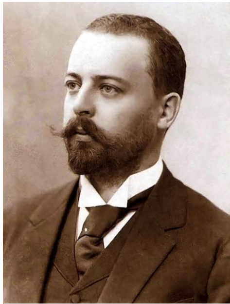
Рисунок 2 – Ф.О. Шехтель, 33-35 лет

Но для архитектора молодость – вовсе не столь уже необходимый атрибут профессии. Здесь больше ценятся опыт, мастерство и, конечно, известность мастера, которые приходят с годами. Разумеется, выгодные внешние данные молодого Шехтеля (рис. 2) и его прекрасная манера держать себя в обществе, располагают к нему заказчиков и отчасти также способствуют превращению в «модного архитектора», но безусловно главные составляющие его успеха – талант, умение блестяще организовать дело и фантастическая работоспособность.