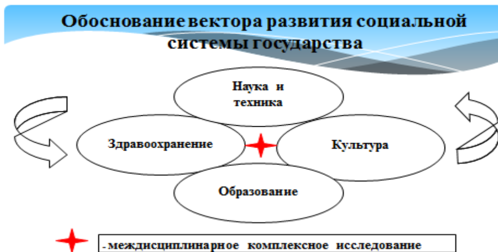
Схема 2 – Взаимосвязь и взаимодействие образования, здравоохранения, науки и культуры в социальной системе государства

На взгляд Н.И. Калакова общество – это совокупность людей, объединённых исторически обусловленными социальными формами совместной жизни и деятельности, с применением способов организации социального и экономического взаимодействия между собой, обеспечивающих удовлетворение их основных потребностей и интересов (см.: Глобалистическая прогностика: теория, методология и практика прогностического образования и науки в России в целях достижения вершин развития универсализации общества : монография / под общ. ред. Н.И. Калакова, О.В. Зиборова. – Москва; Ярославль: Филигрань, 2019. – 592 с. ISBN 978-5-6042230-1-7 Н.И.).