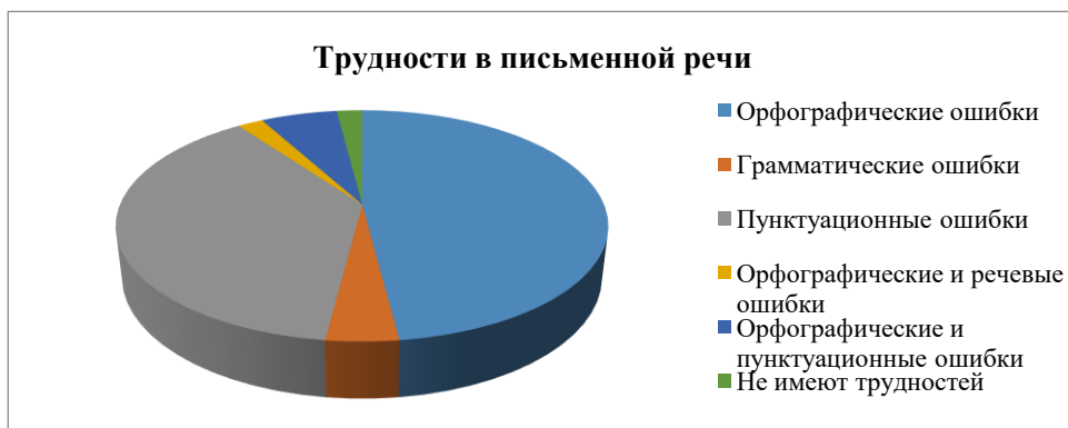
Рисунок 2 – Трудности в письменной речи

Анализируя свою письменную речь, обучающиеся отметили, что они делают орфографические (ошибки в написании) (48% испытуемых), 4% обучающихся отметили у себя грамматические (ошибки в согласовании слов в предложении, в окончаниях слов), 38% испытуемых допускают пунктуационные (ошибки в постановке знаков препинания). Лишь 2% испытуемых делают орфографические (ошибки в написании) и речевые (ошибки, связанные с неправильным употреблением слов, с непониманием их значения); 6% испытуемых допускают орфографические (ошибки в написании) и пунктуационные (ошибки в постановке знаков препинания) и только у 2% обучающихся нет ошибок в письменной речи.