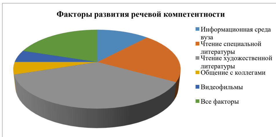
Рисунок 5 – Факторы развития речевой компетентности

Отвечая на вопрос о факторах формирования речевой компетентности, обучающиеся назвали следующие: информационная среда вуза (12%), чтение специальной литературы (21%), чтение художественной литературы (37%), общение с коллегами (5%), видеофильмы, видеофрагменты (5%), все факторы (20%).