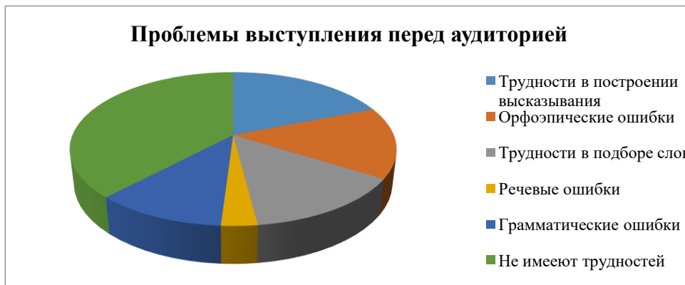
Рисунок 1 – Трудности, связанные с выступлением перед аудиторией

Отвечая на вопросы о трудностях выступления перед аудиторией, 72% обучающихся не испытывают никаких проблем, у 28% такие трудности наблюдаются. Около 19% обучающихся не могут правильно построить высказывание; 15 % обучающихся делают много орфоэпических ошибок (ошибок в постановке ударений, произношении слов); 14% испытуемых трудно подбирают слова и связывают их в предложение; 3% обучающихся делают много речевых ошибок (ошибок, связанных с неправильным употреблением слов, с непониманием их значения); 11% обучающихся делают много грамматических ошибок (ошибок в согласовании слов в предложении, в окончаниях слов), 38% испытуемых не имеют трудностей в построении устного высказывания.