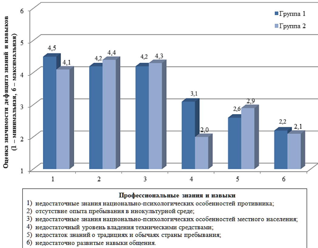
Рисунок 2 – Усредненные оценки профессиональных знаний и навыков, недостаточный уровень развития которых затруднял выполнение задачи

В свою очередь, военнослужащие из группы 2 по сравнению с участниками из группы 1 выше оценивали значимость знаний традиций и обычаев страны пребывания. 67% военнослужащих, выполнявших служебно-боевые задачи в рамках анализируемой деятельности, испытывали трудности в работе, обусловленные дефицитом знаний национально-обусловленных особенностей населения зарубежного государства.