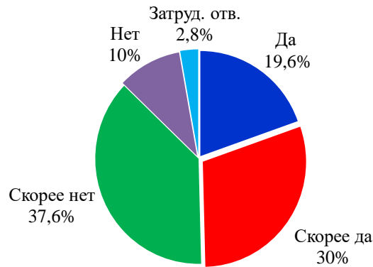
Рисунок 1 – Распределение ответов на вопрос: «Способны ли Вы повлиять на улучшение ситуации в стране?»

этом почти половина опрошенных считает, что в той или иной степени может повлиять на ситуацию в России, способствовать ее улучшению. Стоит отметить, что уверены в этом около 20% респондентов, остальные 30% склоняются к положительному ответу (Рисунок 1). Таким образом, очевидно, что студенты не равнодушны к своей стране.