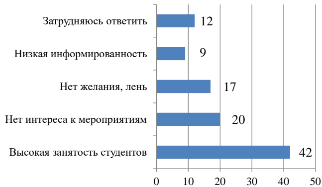
Рисунок 4 – Причины низкой активности студентов в патриотических мероприятиях

В ходе исследования было выявлено, при каких условиях студенты все-таки будут готовы принимать участие в патриотических мероприятиях? Только 28% опрошенных не будут участвовать в этом ни при каких обстоятельствах. Более трети отметили, что с большой вероятностью посетят такие мероприятия в том случае, если они будут интересными, увлекательными, неформальными. Около 20% опрошенных указали, что готовы участвовать в них только тогда, когда у них будет свободное время. Еще 10% готовы заниматься этим за какие-либо бонусы, связанные с учебой. И лишь 7% затруднились ответить на данный вопрос.