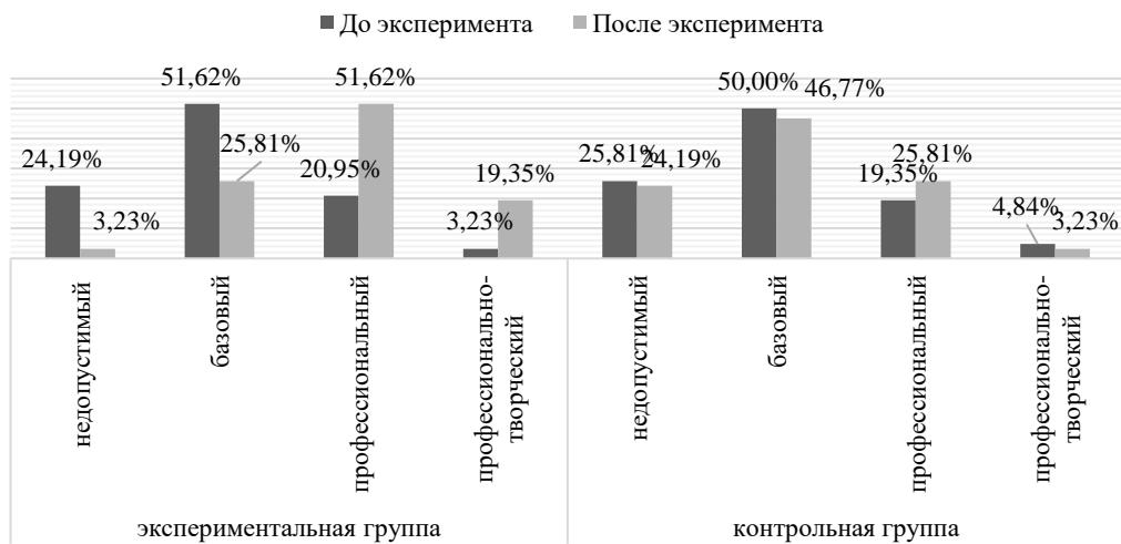
Рисунок 1 – Процентное распределение подготовленности сотрудников полиции двух исследовательских групп к работе с подростками в ЦВСНП до и после эксперимента

На констатирующем, формирующем и итоговом этапах эксперимента осуществлялся педагогический мониторинг, результаты которого позволяют объективно судить об эффективности разработанной технологии. В конце эксперимента в экспериментальной группе произошли достоверно значимые позитивные изменения в показателях уровня подготовленности сотрудников полиции к работе с подростками в ЦВСНП, тогда как в контрольной группе таких изменений выявлено не было (рисунок 1).