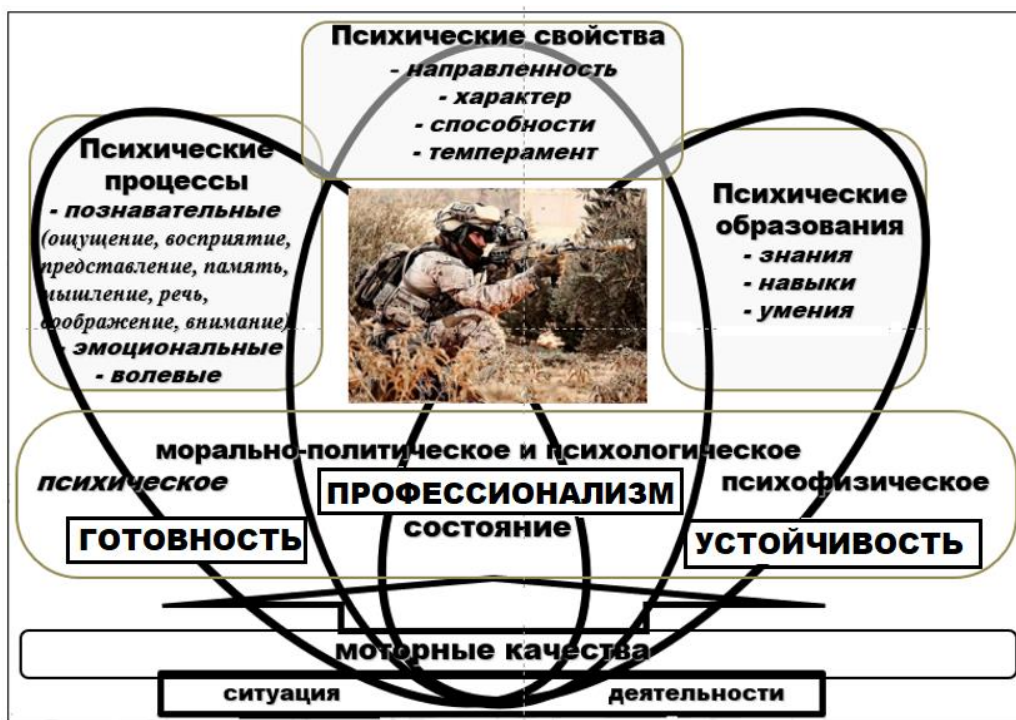
Рисунок 2 – Деятельностная (по единице анализа) модель личности военнослужащего (на фоне элементаристской)

В проведенных с его позиций многочисленных исследованиях непротиворечиво констатируется, что выполнение задач по предназначению достигается военнослужащим уже такими психологическими характеристиками его личности более высоко порядка, как профессионализм, психологическая готовность, психическая устойчивость и рядом эмерджентных качеств (проявляющимся при наличии исходных, но не сводимых к ним) 1 . (М.И. Дьяченко, М.П. Коробейников, П.А. Корчемный, В.В. Сысов, А.Ю. Федотов и др.) (рисунок 2).