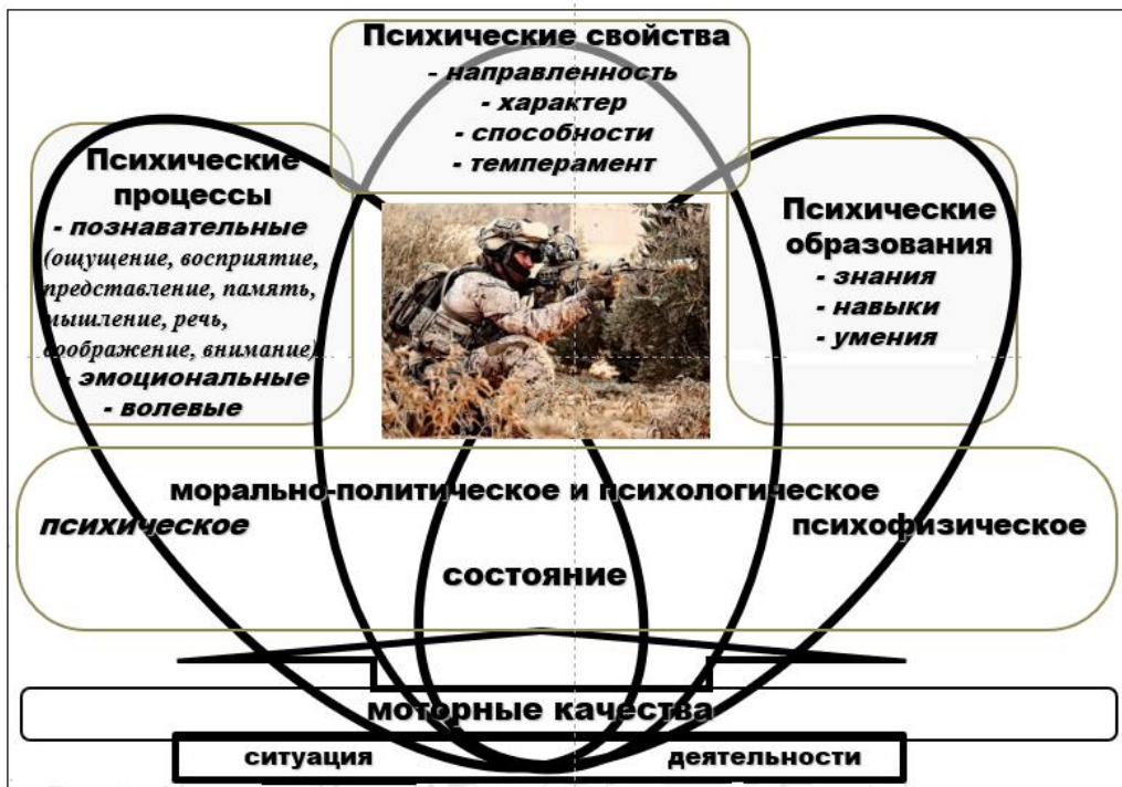
Рисунок 1 – Место морально-политического и психологического состояния в структуре личности военнослужащего (по элементам)

Из приведенной на рисунке 1 элементаристской модели следует, что МППС – обобщенное оценочное понятие, выражающее уровень безусловности выполнения военнослужащим задачи по предназначению в конкретных условиях и в этом контексте является синонимом психологии личности. Вариативность МППС определяется особенностями ситуации деятельности, структурными элементами которой являются задача-условия-субъект (военнослужащий) [4].