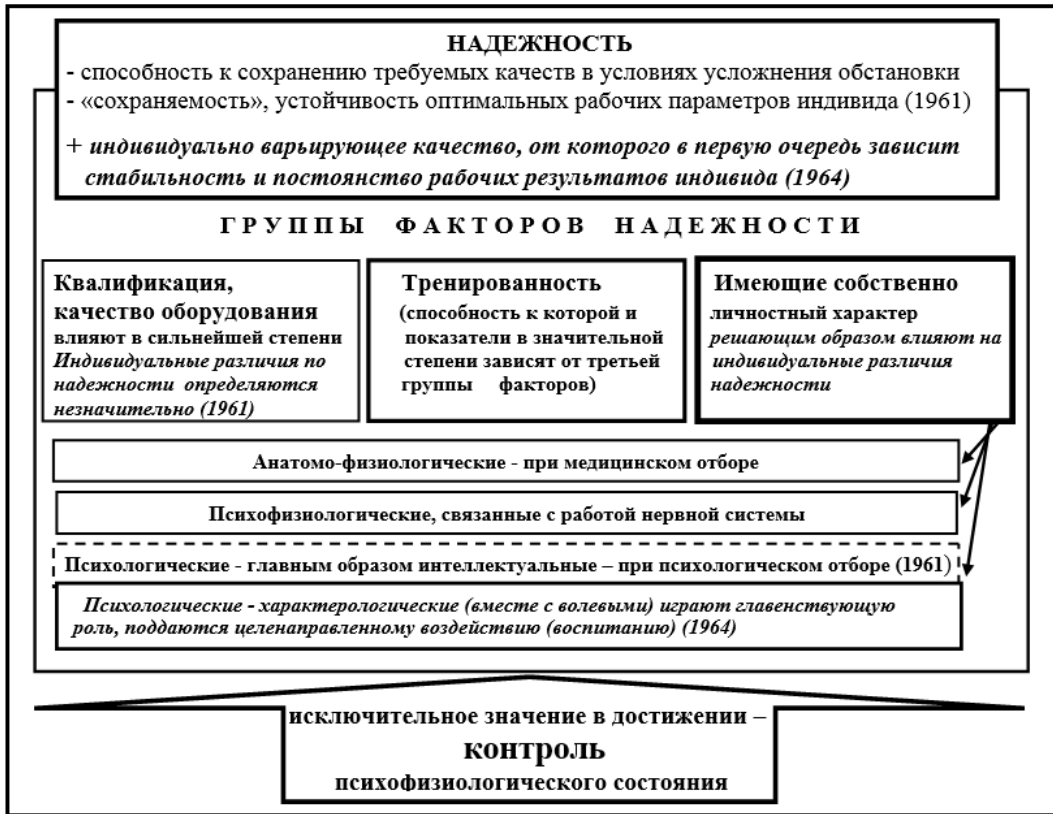
Рисунок 4 – Определение В.Д. Небылицыным сущности, факторов, условий достижения надежности специалиста (1961 и 1964 гг.)

в) с расширением понимания сущности надежности не только как способности к сохранению требуемых качеств в условиях усложнения обстановки..., но и как индивидуально варьирующего качества, от которого в первую очередь зависит стабильность и постоянство профессиональных результатов специалиста.