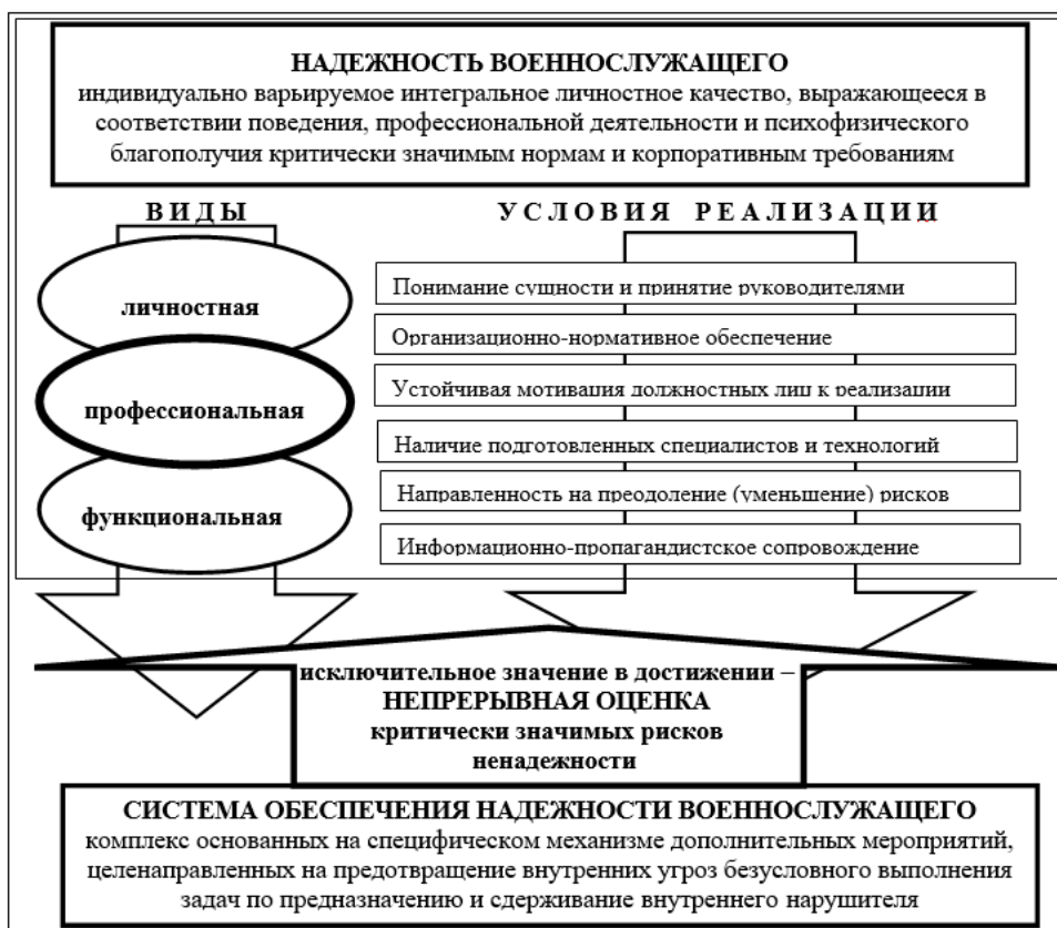
Рисунок 5 – Психологический подход к определению обеспечения надежности военнослужащего

Личностная надежность характеризует повседневное поведение, соблюдение ограничений и требований, определяемых принадлежностью к конкретной профессии. Ее важной стороной является политическая лояльность, ответственность, мотивация выполнения профессиональных задач, соответствие предъявляемым социумом морально-нравственным требованиям.