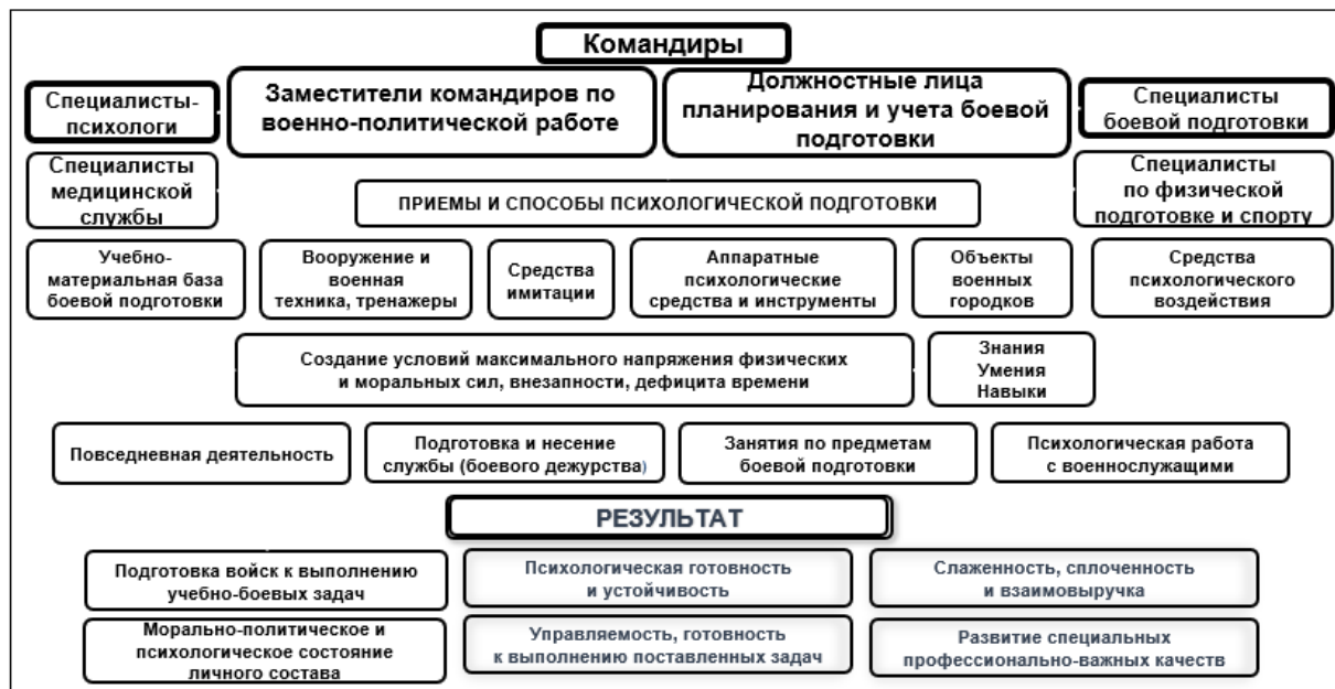
Рисунок 1 – Модель организации психологической подготовки личного состава

(воинской части); план подготовки соединения (воинской части); план-календарь основных мероприятий на месяц; перспективный (текущий) план организации работы (психологической работы) с личным составом; план работы методического совета воинской части; план развития и совершенствования учебно-материальной базы; расписание занятий по профессионально-должностной (должностной) подготовке; планы работы отделений (служб), личные планы должностных лиц соединения (воинской части); сводное расписание (расписание) занятий; план-конспекты проведения занятий по предметам боевой подготовки; курсы, правила, программы, методические рекомендации.