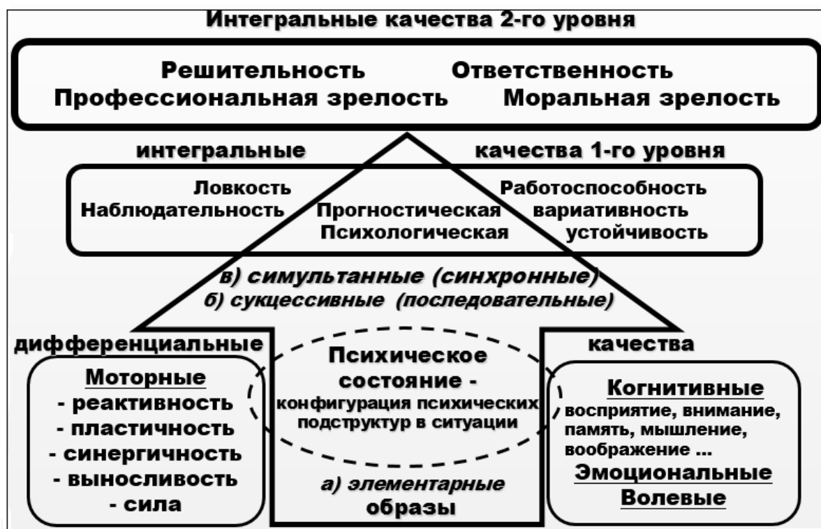
Рисунок 4. Структурно-содержательная модель психологической подготовки как профессионально-личностного развития военнослужащего

Ядром подхода предложена комплексная система развития универсальной профессионально-ориентированной сенсомоторной базы в рамках освоения разделов и дисциплин профессиональной подготовки (рис. 4).