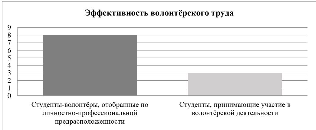
Рисунок 2 – Анализ эффективности групп, предрасположенных к волонтерской деятельности студентов и студентов, эпизодически участвующих в волонтерском движении

Осуществив отбор студентов для волонтерской деятельности по выявленным показателям личностно-профессиональной предрасположенности, проведён сравнительный анализ эффективности их добровольческого труда. Предрасположенные к волонтерской деятельности студенты показывают лучшие результаты в работе, они более стабильны и менее склонны к перемене вида деятельности. Различия в эффективности групп студентов-волонтеров и студентов показано на рисунке 2. Числовые значения представлены в стандартных баллах – стенах.