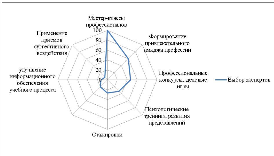
Рисунок 3 – Конструктивные пути формирования представлений у студентов об их будущей профессиональной деятельности (экспертный опрос)

В результате опроса, эксперты предложили следующие варианты конструктивных путей формирования представлений у студентов об их будущей профессиональной деятельности (рисунок 3).