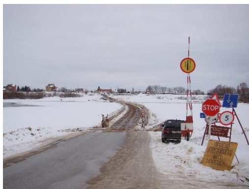
Рисунок 3 – Понтонный мост у сел Старая Рязань и Фатьяновка