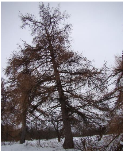
Рисунок 5 – Фрагмент парковой лиственничной аллеи усадьбы

остановить и зафиксировать грунтовый блок в относительно безопасном состоянии. Несмотря на некоторую стабилизацию ситуации, требуется провести геоморфологические изыскания: изучить рельеф территории и особенно правого берега Оки, оценить внешние признаки, размеры, происхождение, возраст, закономерности развития оползня во времени и пространстве, выявить современные рельефообразующие процессы, их распространение и объединение в естественные группы, и составить прогноз дальнейшего изменения рельефа данной территории. Это важно для экологической и технической безопасности эксплуатации церкви Воскресения Христова, определения точных координат на местности для восстановления разрушенных зданий усадьбы – «Красного дома» и «Белого дома».