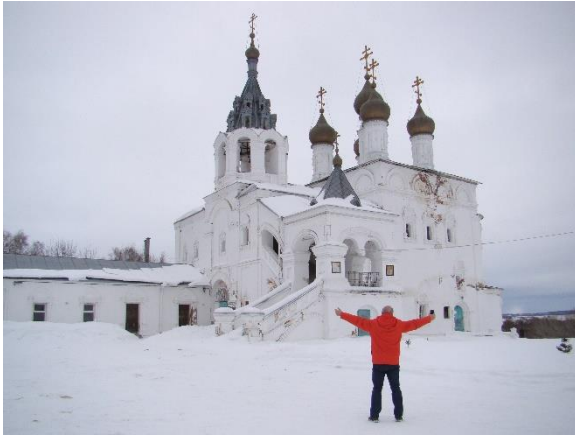
Рисунок 4 – Храм Воскресения Христова в Исадах

Декоративное убранство здания очень простое, но выразительное. Кроме красивых перспективных порталов здесь применены два типа наличников окон: первый с килевидными сандриками, поддерживаемыми стоящими на консолях полуколонками, обрамляющими проем окна, второй состоит из профилированной прямоугольной рамки с треугольным завершением сверху. Объект является памятником архитектуры федерального значения.