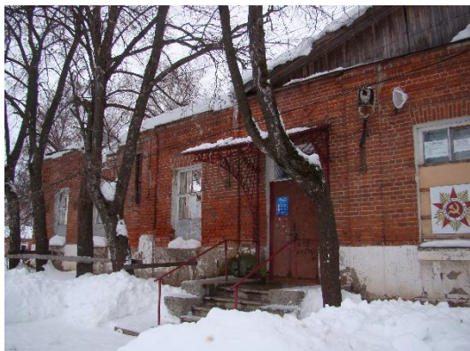
Рисунок 7 – Бывшая земская школа, здание 1912 г. (в настоящее время – сельский Дом культуры)