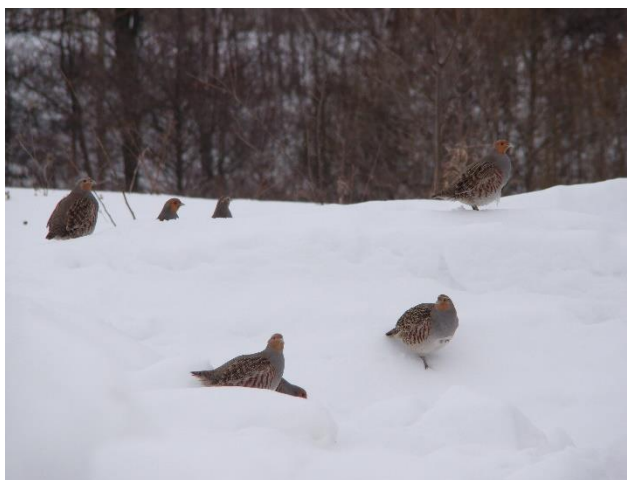
Рисунок 6 – Куропатки на территории проектируемого комплекса

Частично сохранилось, но требует проведения реставрационных работ, здание земской школы, построенной В.Н. Кожиним в 1912 году (рис. 7). В настоящее время левое крыло здания находится в аварийном состоянии: кровля и стропильная система полностью разрушены, стены покрыты плесенью и мхом, полы провалились. Несмотря на это, правое крыло здания продолжают использовать как сельский дом культуры. В Стратегии развития отрасли культуры Рязанской области до 2030 года в разделе, касающемся учреждений культуры клубного типа, Исадский сельский дом культуры включен в число двух приоритетных объектов региона для восстановления и оснащения современными техническими средствами культурно-массовой работы, библиотечного обслуживания и художественно-эстетического воспитания.