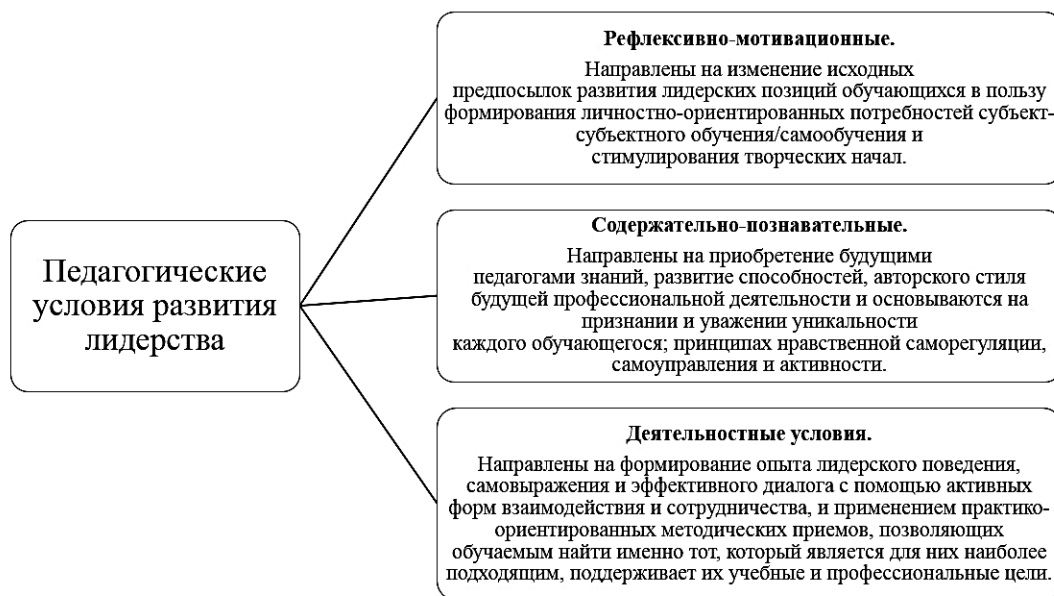
Рисунок 2 – Педагогические условия, образующие лидерское пространство (по И.Б. Бичевой и О.М. Филатовой)

С другой стороны, И.Б. Бичева и О.М. Филатова считают, что самостоятельность и ответственность являются основополагающими качествами, обуславливающими развитие лидерства. Утверждая, что данные характеристики являются основными для формирования лидерства будущих педагогов, авторы предлагают создать в вузе три группы педагогических условий, образующих лидерское пространство (рисунок 2).