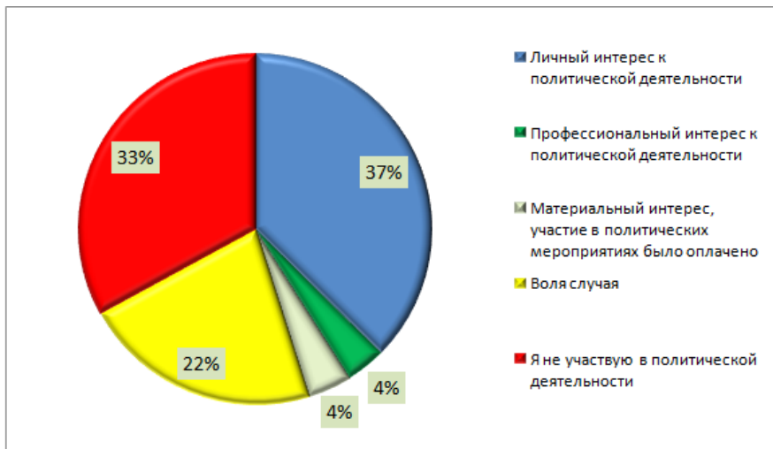
Рисунок 3 – Ответ на вопрос «Какова причина Вашего участия в политических мероприятиях в течение трех предыдущих лет?»

Выясняя у респондентов причину участия в политической деятельности молодежи, был получен довольно интересный результат, который отражен на рисунке 3.