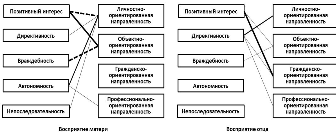
Рисунок 3 – Корреляционная связь между типами направленности личности волонтеров на осуществляемую ими деятельность и их восприятия матери и отца.