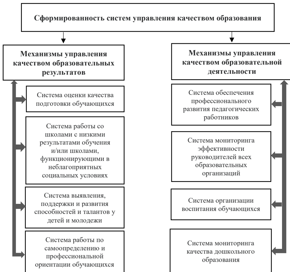
Рисунок 2 – Полная схема оценки качества образования (по данным ФИОКО)

Полная схема оценки приведена на рис. 2.