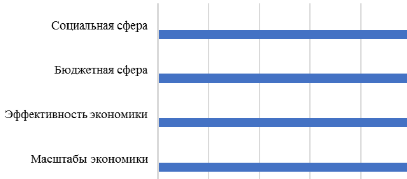
Рисунок 1 – Показатели, определяющие уровень экономического развития региона

В результате такой работы и анализа тысяч ключевых критериев показателей, определяется позицию региона по уровню социально-экономического развития. Эти показатели представлены на рис. 1.