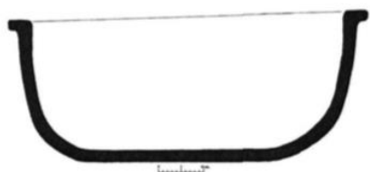
Клазомены Ванна №1 (1 группа), конец VII в. до н.э. Илл. по Sevizoğlu 2015: 266-268

Второй тип датируется шире, VII-VI вв. до н.э., и представлен тремя саркофагами (№ № 2, 3 и 6). Они имеют более сложную форму: один край приподнят и схож со спинкой кресла; дно - округлое, с коническим углублением и наклоном к передней части, где есть отверстие для слива. Саркофаг-ванна №3 отличается наличием рамы по периметру, поэтому имеет утолщенные стенки. Данные захоронения сопровождается достаточно богатый погребальный инвентарь – парфюмерные флаконы, коринфские и ионийские чаши (включая аск конца VII в до н.э.), и также астрагалы.