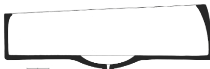
Ванна №4 (3 группа), нач. VII в. до н.э. Илл. по Sevizoğlu 2015: 266-268