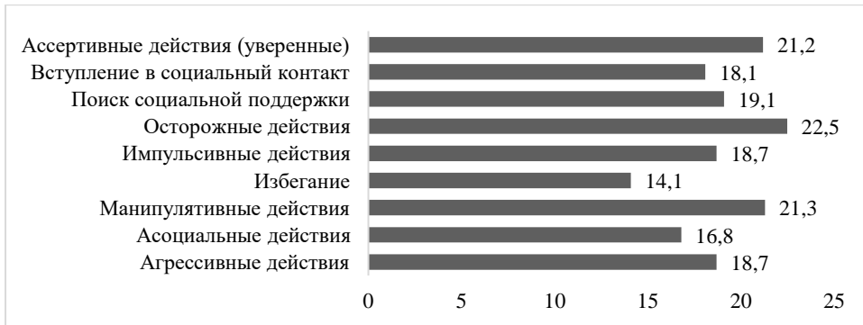
Рисунок 2 – Значения показателей моделей преодолевающего поведения, методика «Стратегии преодоления стрессовых ситуаций, SACS» (С. Хобфолл)

В исследовании значений показателей преодолевающего поведения была выявлена приоритетность ассертивных, осторожных и агрессивных действий в структуре выборов респондентов. Характеристика профиля моделей преодолевающего поведения позволяет отметить наличие среднего уровня активных стратегий, уверенных действий в отстаивании собственных позиций, открытость в целях и намерениях, использование коммуникативных умений, направленных на конструктивное взаимодействие (рисунок 2).