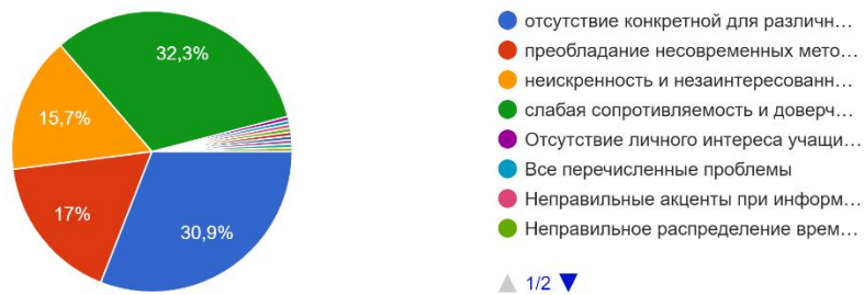
Рисунок 3 – Актуальные проблемы патриотического воспитания молодежи

Какие проблемы в патриотическом воспитании подростков актуальны сейчас: 223 ответа