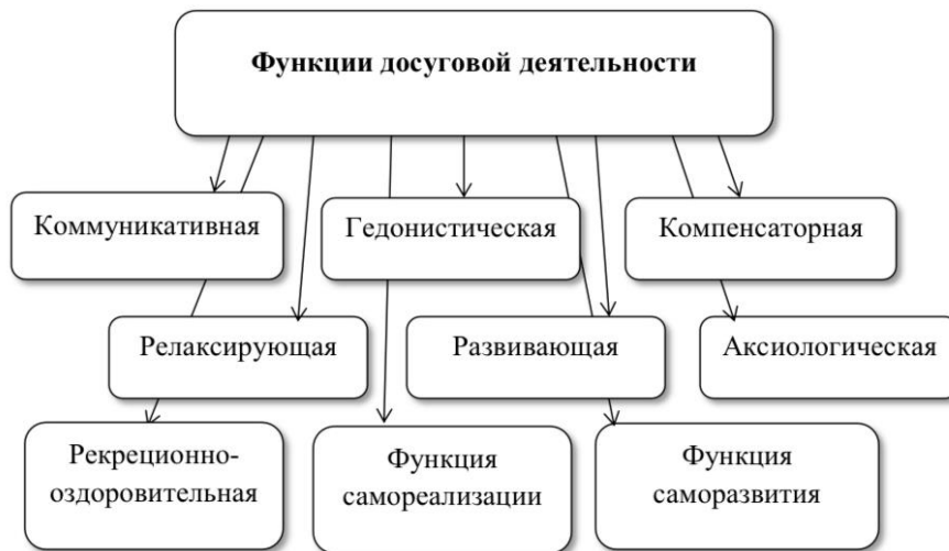
Рисунок 1 – Функции досуговой деятельности

Ж. Дюмазедье рассматривает «досуг» как «совокупность занятий, которым личность может предаваться по доброй воле, чтобы отдыхать, развлекаться, развивать свою информированность или образование, ...будучи свободным, от выполнения профессиональных, семейных и гражданских обязанностей» [28]. А.И. Кравченко, определяет «досуг» как «часть свободного времени (оно является частью внерабочего времени), которым человек располагает по своему усмотрению» [13]. Досуг входит как составная часть в категорию «свободное время». Основные функции досуга можно представить в виде рисунка (рисунок 1).