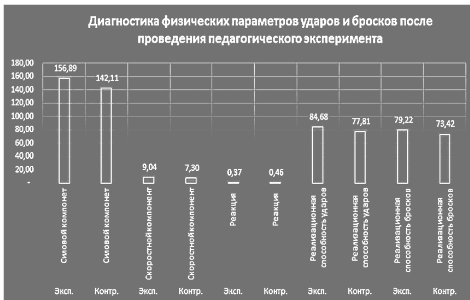
Рисунок 2 – Диаграмма физических параметров выполнения ударов и бросков курсантами экспериментальной и контрольной групп после педагогического эксперимента

Для подтверждения экспериментальной гипотезы о том, что предложенные педагогические условия оказали существенное влияние на овладение и совершенствование ударов и бросков, мы использовали непараметрический критерий Манна-Уитни: