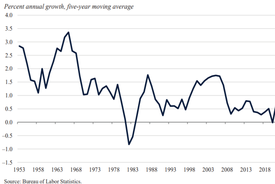
Рисунок 1 – Динамика производительности в США (1953-2021 гг.)

При этом темпы снижения экономического развития в настоящее время в значительной мере опережают негативный тренд в приросте населения на планете. При возникновении объективных ограничений для роста производства, рыночная капиталистическая система, основанная на свободной конкуренции, начинает давать сбои, а при остановке развития перестает нормально функционировать и должна заменяться на распределительную систему [2]. Подобная ситуация актуализирует потребность в трансформациях мирового устройства.