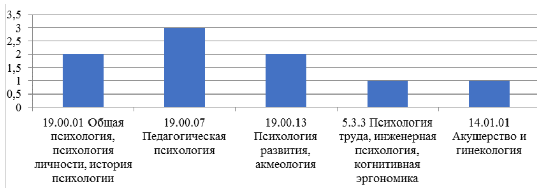
Рисунок 1 – Количество защищенных диссертационных исследований по научным специальностям

Анализ количества защищенных в нашей стране диссертаций показывает, что относительно лидерскую позицию среди исследований, посвященных обеспечению психологического здоровья, занимает педагогическая психология (3 диссертации) (рис. 1), причем имеется 1 диссертация, выходящая за рамки психологической науки (Розенберг И.М., 2018).