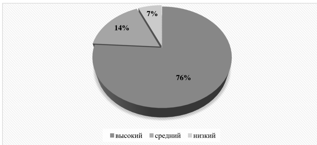
Рисунок 3 – Результаты исследования волевой саморегуляции сотрудников УИС

По данным, проведенной методики «ВСК» (волевая саморегуляция) результатов исследования указывают, что высокий уровень самоконтроля поведения имеют большинство респондентов (69,9 %), 6,6 % сотрудников имеют сниженный самоконтроль, у остальных 23,5 % уровень волевой саморегуляции в пределах средней психологической нормы. Отмечается также высокий уровень настойчивости свойственный 76,6 % обследуемых.