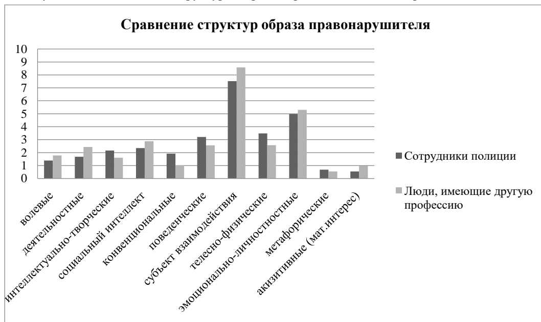
Диаграмма 1 – Сравнение структур образа правонарушителя

Результаты исследования структуры образов представлены на диаграмме 1.