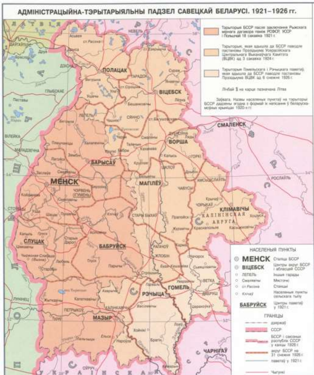
Рисунок 2 – Административно-территориальное деление Советской Белоруссии 1921–1926 гг.

В составе ССРБ осталось только шесть уездов бывшей Минской губернии (рис. 2), что оказывало негативное влияние на социально-экономическую, общественно-политическую, национально-культурную жизнь белорусов как в Советской, так и в Западной Беларуси.