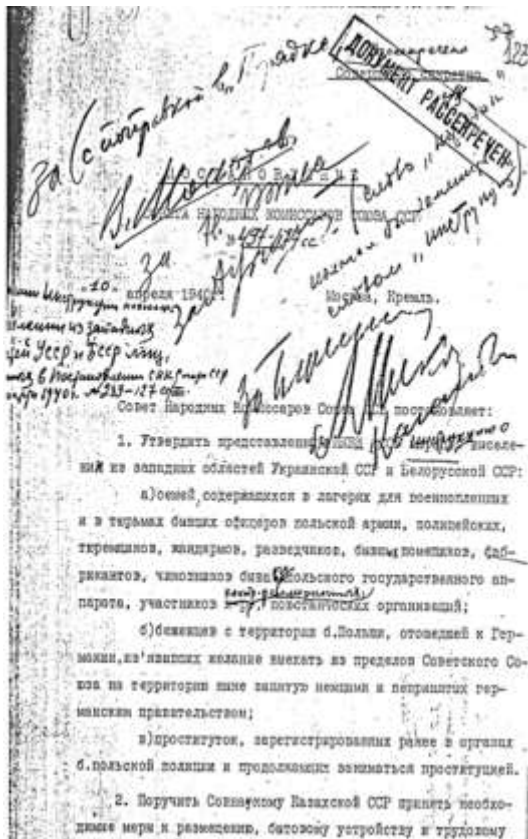
Рисунок 10 – Фрагмент постановления СНК СССР от 10 апреля 1940 г. о выселении из западных областей УССР и БССР ряда категорий населения

Государство должно было обеспечить безопасность на своих западных рубежах. В связи со сложившейся ситуацией было принято постановление СНК СССР от 10 апреля 1940 года о выселении из западных областей УССР и БССР ряда категорий населения: семей бывших польских офицеров, жандармов, полицейских, тюремщиков, разведчиков, помещиков, фабрикантов, чиновников, участников польского националистического подполья, переселялись также асоциальные элементы и беженцы, которые не хотели принимать советское гражданство [45, с. 38] (рис. 10).