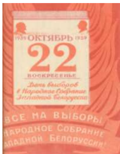
Рисунок 7 – Листовка с призывом к участию в выборах в Народное Собрание Западной Беларуси

В выборах 22 октября 1939 года из общего числа 2 763 191 избирателя участвовало 2 672 280 человек, что составляло 96,7 %. За выдвинутых кандидатов проголосовали 2 409 522 избирателя, соответственно 90,7 %, при этом 14 932 бюллетеня были признаны недействительными. В двух избирательных