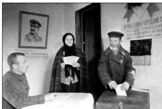
Рисунок 8 – Крестьяне д. Переходы Белостокского повета голосуют на выборах в Народное Собрание Западной Беларуси. 22 октября 1939 г.