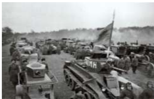
Рисунок 2 – Части Красной Армии готовятся вступить в Белосток. Конец сентября 1939 г.

Наиболее упорные бои развернулись 20–21 сентября в Гродно, где 15-й танковый корпус потерял 12 танков, а также 47 человек убитыми и 156 ранеными [44, л. 51]. Потери, понесённые