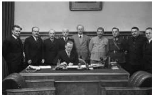
Рисунок 4 – Подписание советско-литовского договора о передаче Литовской республике Вильно и Виленской области. Москва. 10 октября 1939 г.

Кроме того, по договору между правительствами СССР и Литовской Республики, который был подписан 10 октября 1939 года, Вильно и так называемая Виленская область (Виленско-Трокский, часть территории Свенцянского и Браславского поватов) общей площадью 6 900 км 2 была передана Литве без учёта национального состава этих земель (рис. 4). В основе этих решений лежали в первую очередь политические соображения [21, с. 201].