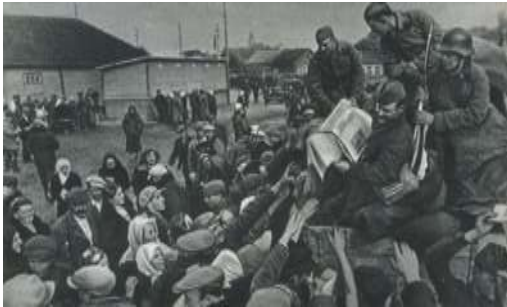
Рисунок 3 – Жители одного из местечек Западной Беларуси встречают воинов Красной Армии. Вторая половина сентября 1939 г.

частями Белорусского фронта при освобождении Гродно от польских военных формирований, объясняются плохим взаимодействием танковых и стрелковых подразделений, участвовавших в этой операции, а также полным отсутствием разведанных о противнике. Общие потери войск Белорусского фронта составили 480 погибших, 642 раненых и 13 пропавших без вести. В период с 17 по 30 сентября 1939 года войска Белорусского фронта интернировали и разоружили 60 202 польских военнослужащих, среди которых насчитывалось 2 066 офицеров [12, с. 86-87; 17].