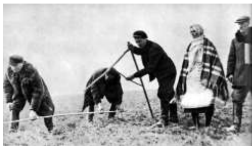
Рисунок 6 – Раздел помещичьей земли крестьянами западнобелорусской д. Соболево. Весна 1940 г.

Опираясь на поддержку большинства населения края, Временные управления и крестьянские комитеты устанавливали новый порядок. Не дожидаясь законодательных актов новой власти, крестьянские комитеты самостоятельно брали на учёт имущество помещиков, осадников, делили помещичью и церковную землю среди безземельных и малоземельных крестьян, которые получили почти 431 тыс. га земли, преимущественно пахотной и сенокоса (рис. 6).