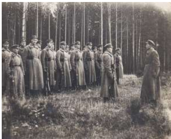
Рисунок 1 – Озвучивание приказа о переходе советско-польской границы в одной из частей Красной Армии на территории БССР. 16 сентября 1939 г.

В 16:00 16 сентября 1939 года в частях Красной Армии Белорусского фронта был зачитан приказ о начале выступления на следующий день 17 сентября в освободительный поход на запад (рис. 1). В приказе особо подчёркивалась освободительная миссия советских войск, которые должны оказать срочную помощь украинским и белорусским рабочим, чтобы спасти их и взять под защиту от врага. Кто этот враг не уточнялось. Советским войскам было запрещено бомбить и обстреливать из пушек населённые пункты. Требовалось проявлять лояльное отношение к польским военнослужащим, если они не будут оказывать вооружённого сопротивления. Белорусским фронтом командовал командарм 2-го ранга М. Ковалёв. Начальником штаба являлся бывший глава советской военной миссии в Берлине комкор М. Пуркаев. Фронт состоял из 4 армий – 3-й, 4-й, 10-й и 11-й, 23-го стрелкового корпуса и Дзержинской конно-механизированной группы; всего насчитывалось 200 802 бойца и командира [43, Л. 8].